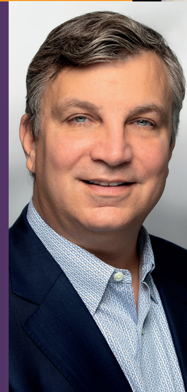
John V. Oyler, CEO BeiGene, Bâle

«La région compte plus de 700 fabricants biopharmaceutiques allant de la petite entreprise aux géants tels que Novartis et Roche. Le choix du site géographique revêt une importance capitale dans la mesure où l'on souhaite intégrer l'Europe dans sa vision d'entreprise globale.»