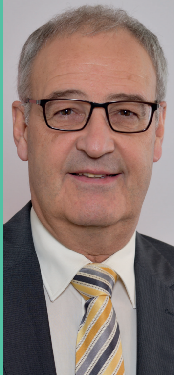
Guy Parmelin, Conseiller fédéral

«Le pôle des sciences de la vie de la région Basel Area revêt une importance capitale pour l'économie nationale, et occupe une position de pointe en Europe et dans le monde.»