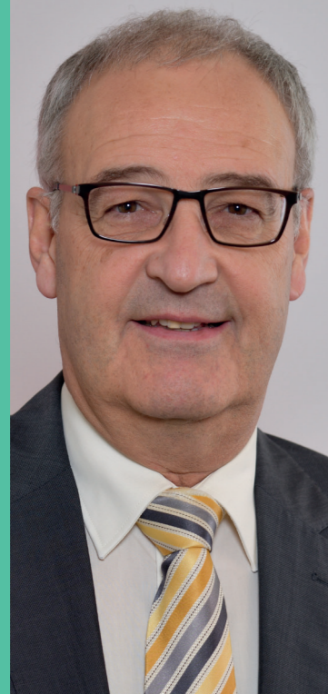
Guy Parmelin, Conseiller fédéral

«Le pôle des sciences de la vie de la région Basel Area revêt une importance capitale pour l'économie nationale, et occupe une position de pointe en Europe et dans le monde.»